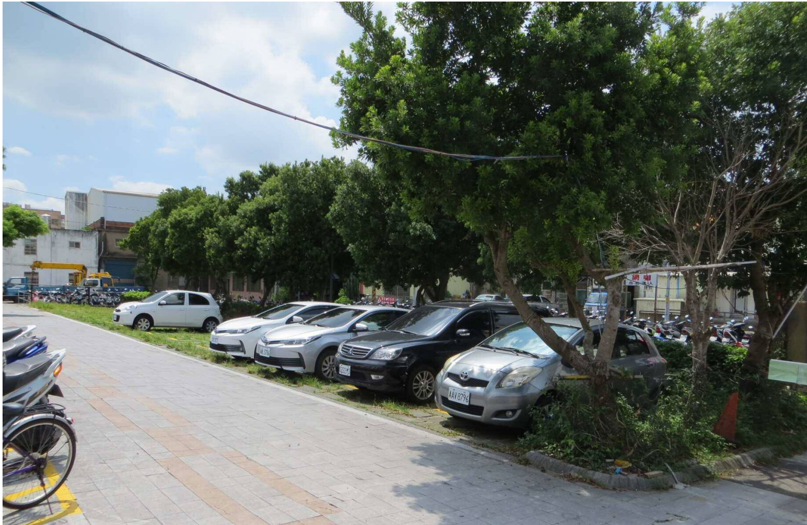
楊梅站北側停車場現場照片