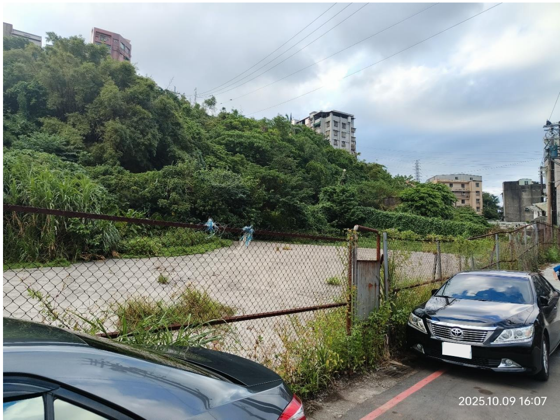
基隆市安樂區西定段 326-2 地號現場照片