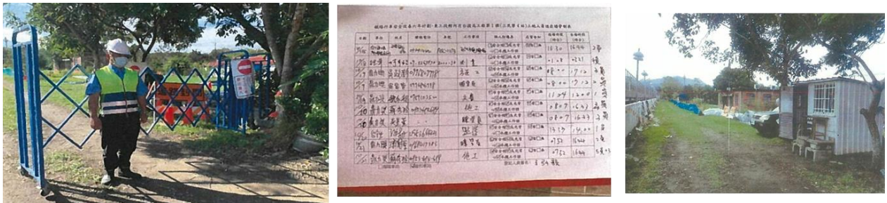
圖 3 臺鐵工地安全管理