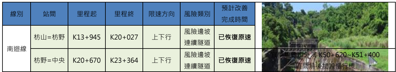
圖 7 東線列車降速運轉