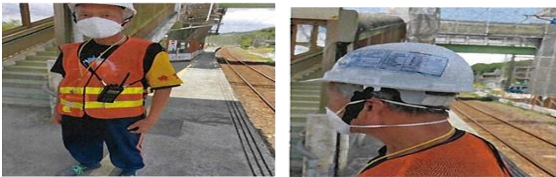
圖 5 臺鐵臨軌工程人員安全強化措施