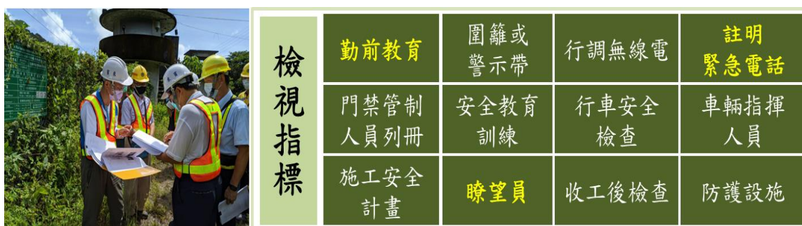
圖 1 臺鐵局臨軌在建工程 12 項檢視項目

加強各工地安全管理，派專人保管工地大門鑰匙，管制人員進出，並於工地設置 CCTV 或電子圍籬，實施強化安全控管，如圖 1 所示。