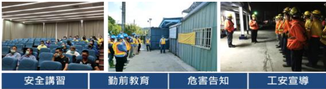
圖 4 臺鐵落實工地人員行車安全教育