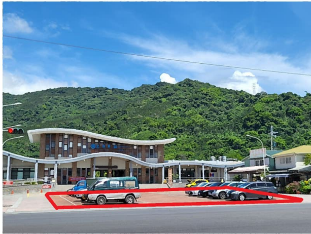
附圖 2 (1737-12、1737-40 地號) 紅線內為標租範圍