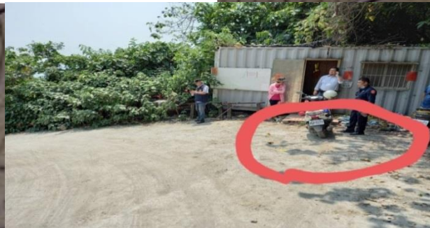
工程車原停放地點