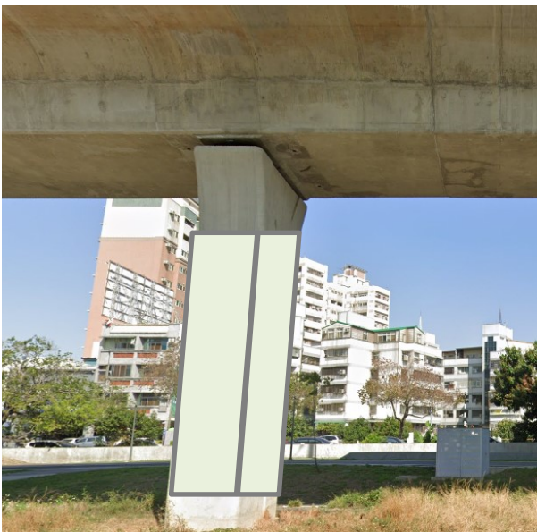
墩柱可刊登範圍示意圖