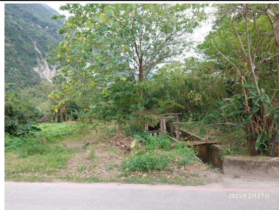
圖四：鐵路西側土地(近秀林鄉上崇德段 725 地號)