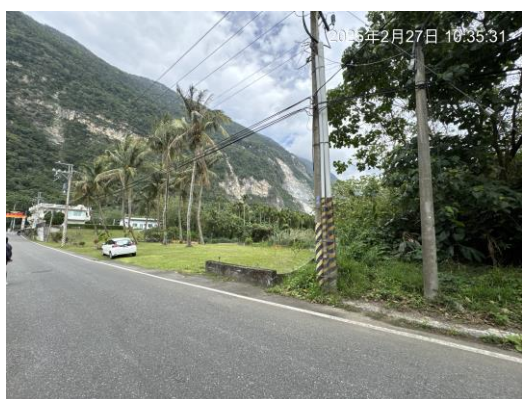
圖五：鐵路西側土地(近花3鄉道北側)