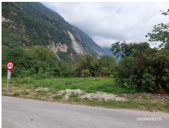
圖三：鐵路西側土地(近秀林鄉上崇德段 725 地號)