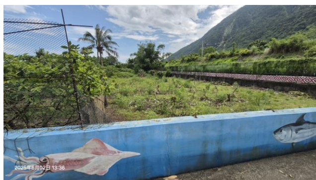
圖一：鐵路東側土地