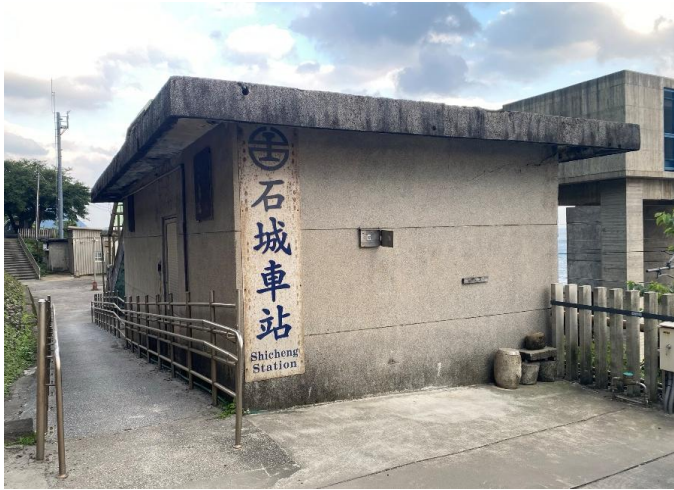
圖1 「最東端車站」石城站