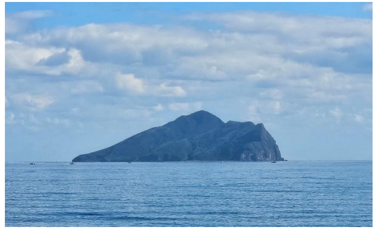
圖2 從車站遠眺龜山島