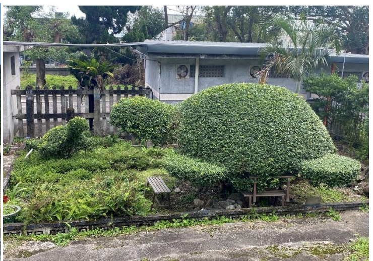
圖6 站內以烏龜童趣造型修剪的植栽