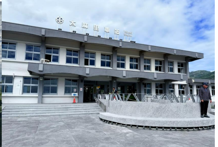
圖10 改建後新增觀景台可眺望太平洋日出