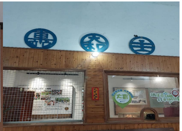
圖12 大富站舊售票窗口美化