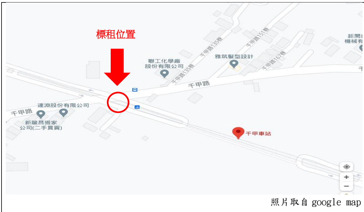
臺鐵公司千甲車站 電池交換站安裝位置圖